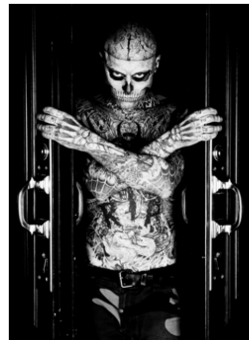
Dmitry Sminov „Zombie Boy“, Foto: Rick Genest