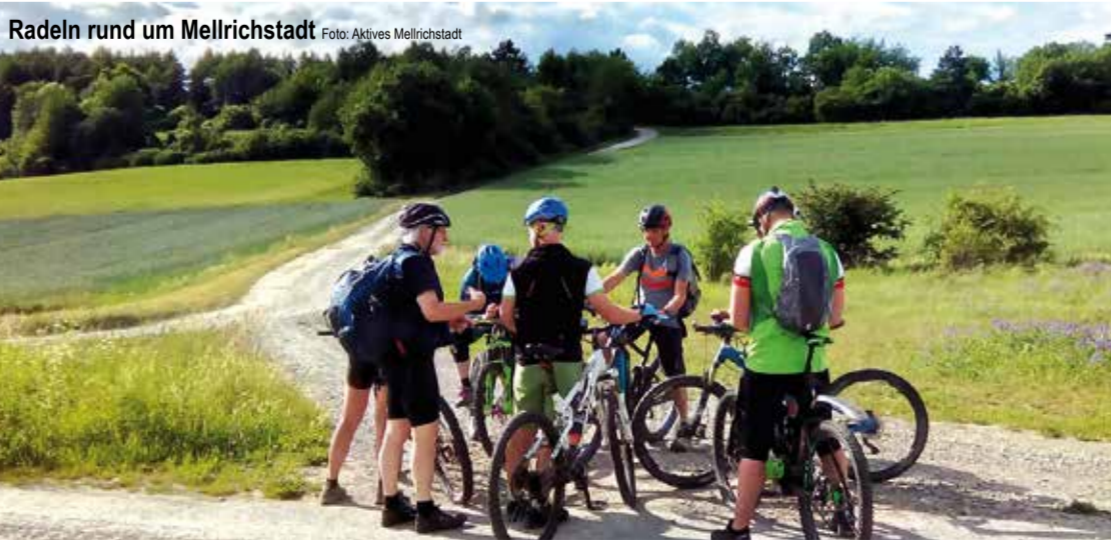
Radeln rund um Mellrichstadt