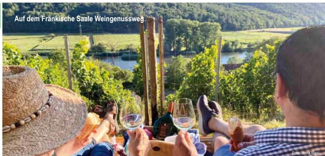
Auf dem Fränkische Saale Weingenussweg