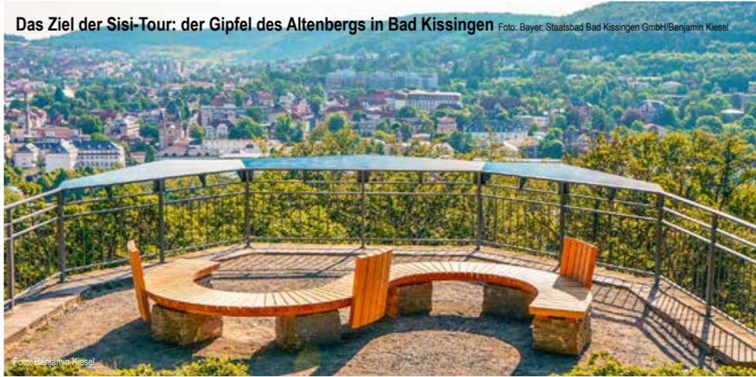
Das Ziel der Sisi-Tour: der Gipfel des Altenbergs in Bad Kissingen