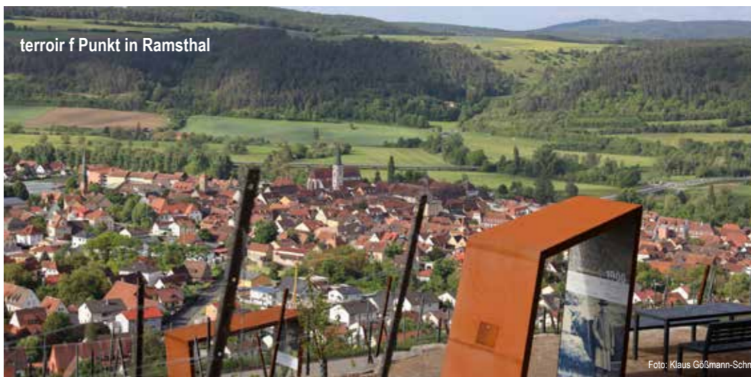
terroir f Punkt in Ramsthal