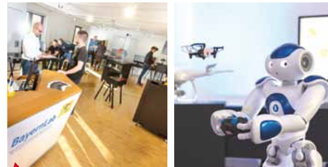
3 Anschauen – Anfassen – Ausprobieren