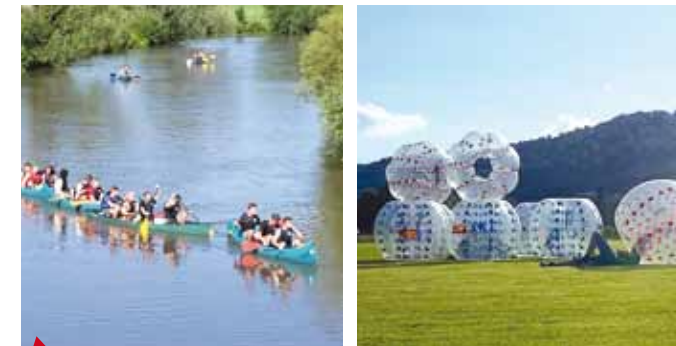
4 Klassenfahrt in die Outdoor Welt

Mathematik entdecken, anwenden, verstehen