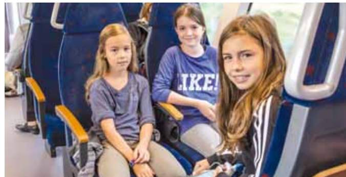
Ein unvergesslicher Tag...