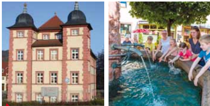
1 MathCityMap – per GPS durch Gemünden a.Main