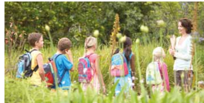
Klassenfahrten mit dem UnterfrankenShuttle