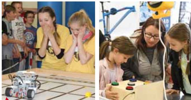
5 wissenswerkstatt Schweinfurt