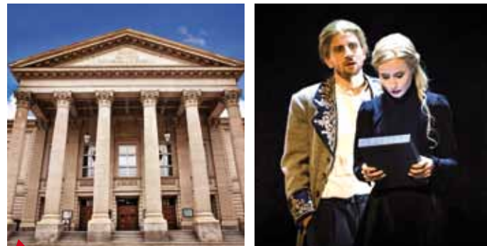
2 Das Meininger Staatstheater