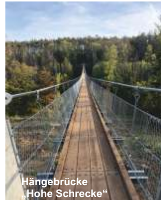
Hängebrücke „Hohe Schrecke“